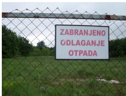
Sl. 4.i 5. Ulaz u sanirano divlje odlagalište "Prijeboj"

U svibnju 2013. godine obavljen je nadzor saniranog divljeg deponija (Sl. 4. i 5.) te je utvrđeno da je sav otpad sa lokacije odvežen, a ograđena površina prekrivena je travom i niskim raslinjem, ograđena i propisno označena. Pregledom je ustanovljeno da nema dovoženja novog otpada.