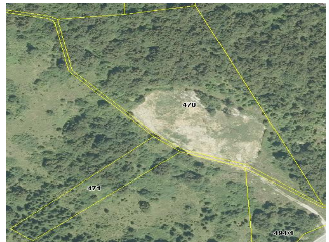
Slika 3. Lokacija saniranog divljeg odlagališta "Prijeboj"

Udaljenost od naselja i prometnice: na lokaciju se dolazi cestom (neasfaltirani odvojak dugačak 100-tinjak metara) koja se na dionici Plitvička jezera - Korenica odvaja od državne ceste D-1 Karlovac - Slunj - Rakovica -Plitvička Jezera - Korenica - Udbina - Gospić - Zadar, u smjeru Bihaća. Udaljenost od spomenutog odvojka magistralne ceste do odlagališta je 3 km.