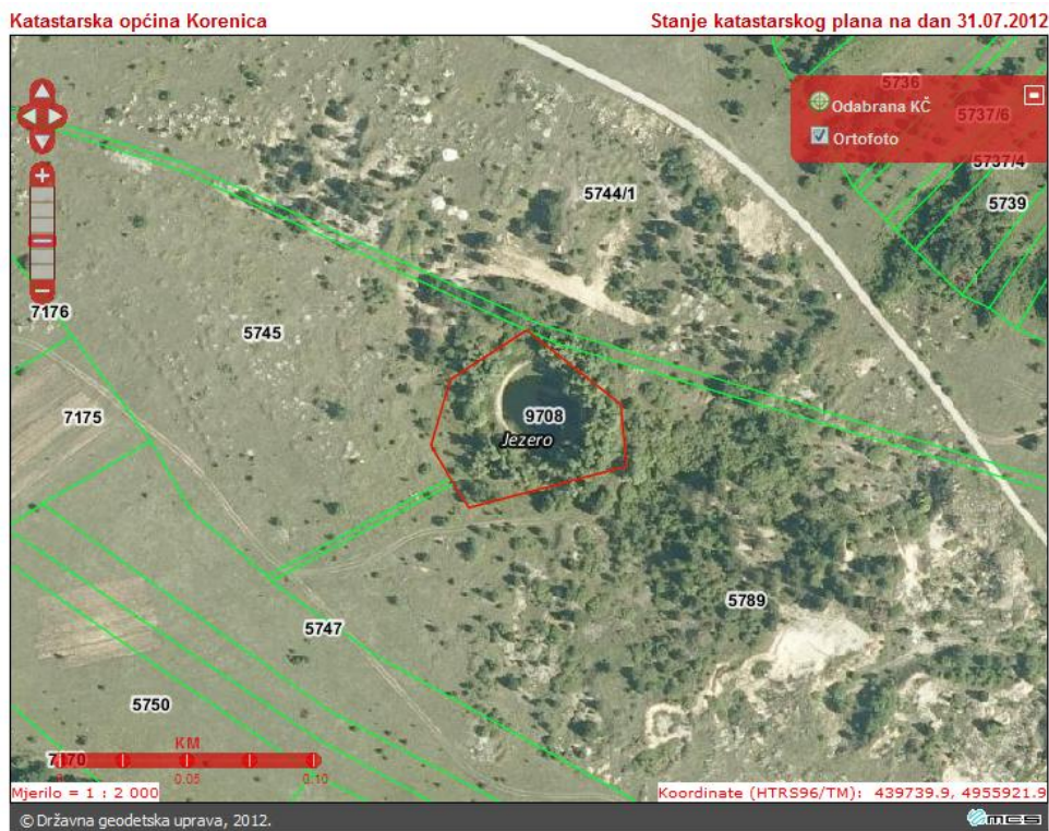
Slika 6. Lokacija saniranog divljeg odlagališta "Crno jezero"

Površine: cca. 30.000m 2 , odloženo cca. 15.000m 3 otpada odloženog od strane stanovništva, nekontrolirano. Uglavnom građevinski otpad, glomazni otpad, automobilske gume, u manjoj mjeri komunalnog otpada.