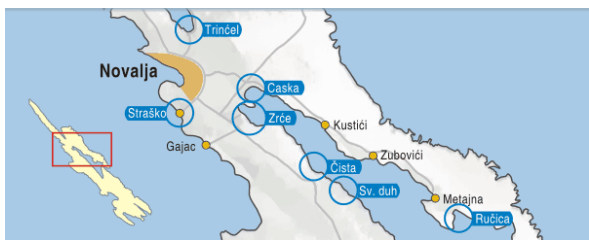
Položaj važnijih plaža na području Grada Novalje

Ljepotom i brojem posjetitelja posebno treba istaknuti plaže Zrće, Planjku, Straško, Casku, Gajac, Jadra, Vrtić, Zubovići, Metajnu, Ručicu i Jakišnicu.