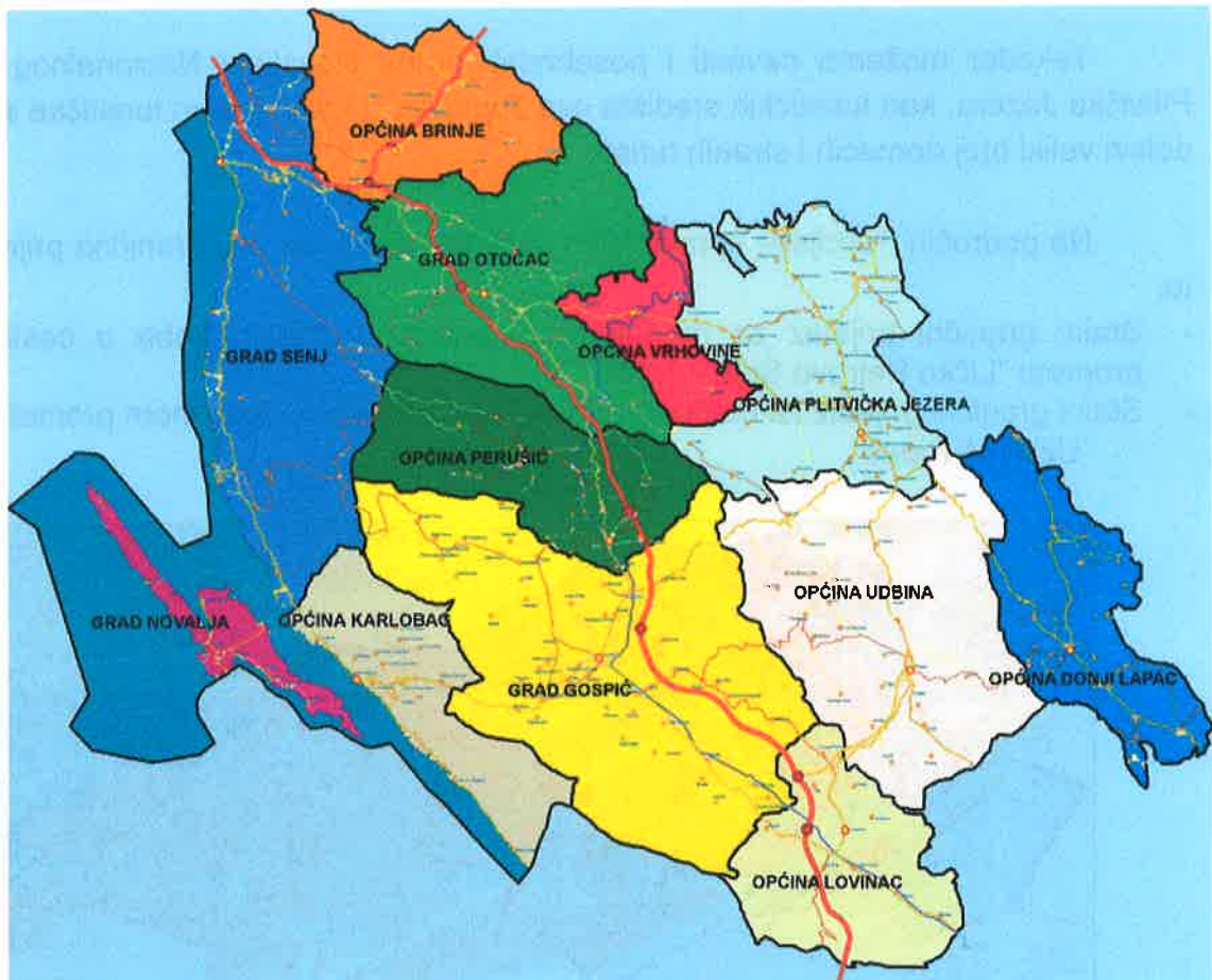
Slika 2. Gradovi i općine županije

Vizija Policijske uprave ličko-senjske je težnja ka održavanju povoljnog stanja sigurnosti, iznalaženje najučinkovitijih metoda za otkrivanje i dokazivanje kaznenih djela, otvorenost prema drugim institucijama, gdje će se građani osjećati sigurni, zaštićeni od svih oblika nasilja, a trend negativnih pojava, događaja i posljedica izgrađivati prema nultoj točki ugrožavanja.