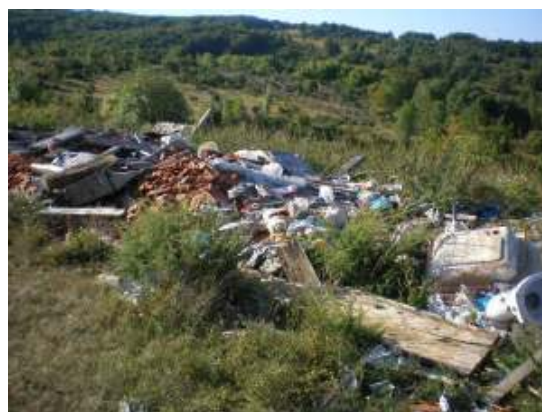
Slika 15 – 17: Gornje Lipice