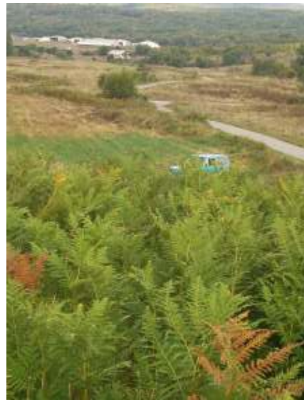
Slika 7 – 8: Lokacija Grič