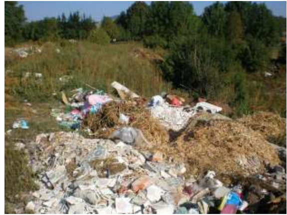
Slika 18 – 19: Borići