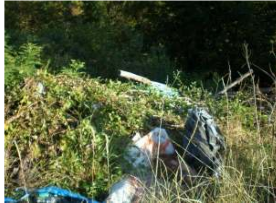
Slika 11 – 12: Lokacija Siničići