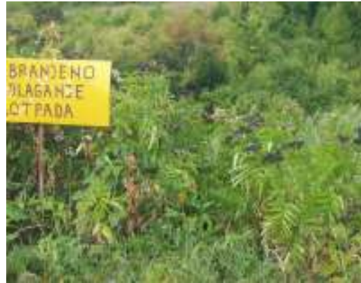
Slika 5 – 6: Lokacija Jurkovi