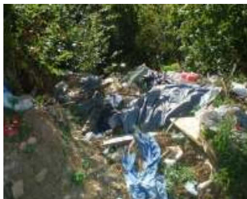
Slika 13 – 14: Lokacija Jelavlje