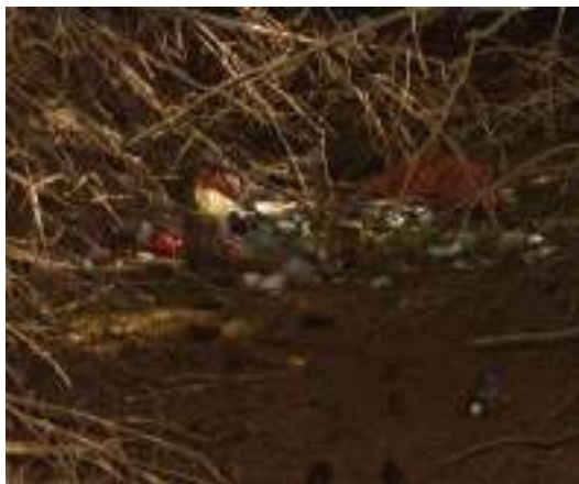
Slika 1 – 2: Lokacija Borik