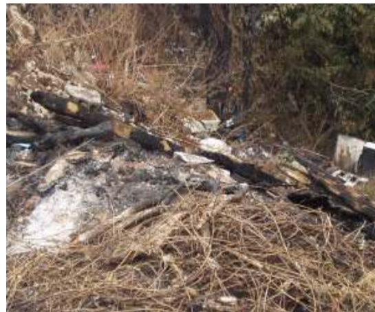
Slika 9 – 10: Lokacija Pećina