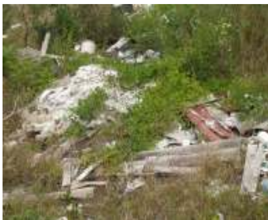
Slika 3 – 4: Lokacija Krčine Razvala