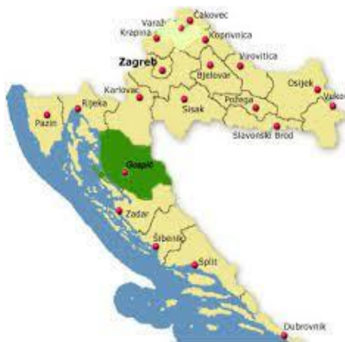
Slika 1 Položaj Ličko-senjske županije na karti Hrvatske

Ličko-senjska županija najveća je po površini među županijama u Republici Hrvatskoj, a prostire se na 5.350,00 km 2 kopnene, 596,63 km 2 morske površine te kopno obuhvaća 9,46% državnog teritorija. Prostire se većim dijelom ličkog zaleđa te obuhvaća dio planine Velebit, njegovo senjsko-karlobaško priobalje i sjeverozapadni dio otoka Paga. U ukupnom prostoru Republike Hrvatske Ličko-senjska županija ima vrlo značajan položaj budući da se nalazi na međi kopnene i primorske hrvatske te svojim položajem predstavlja geoprometno središte Republike Hrvatske. 1