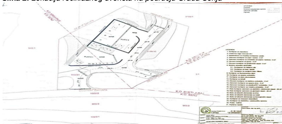
Slika 2: Lokacija reciklažnog dvorišta na području Grada Senja