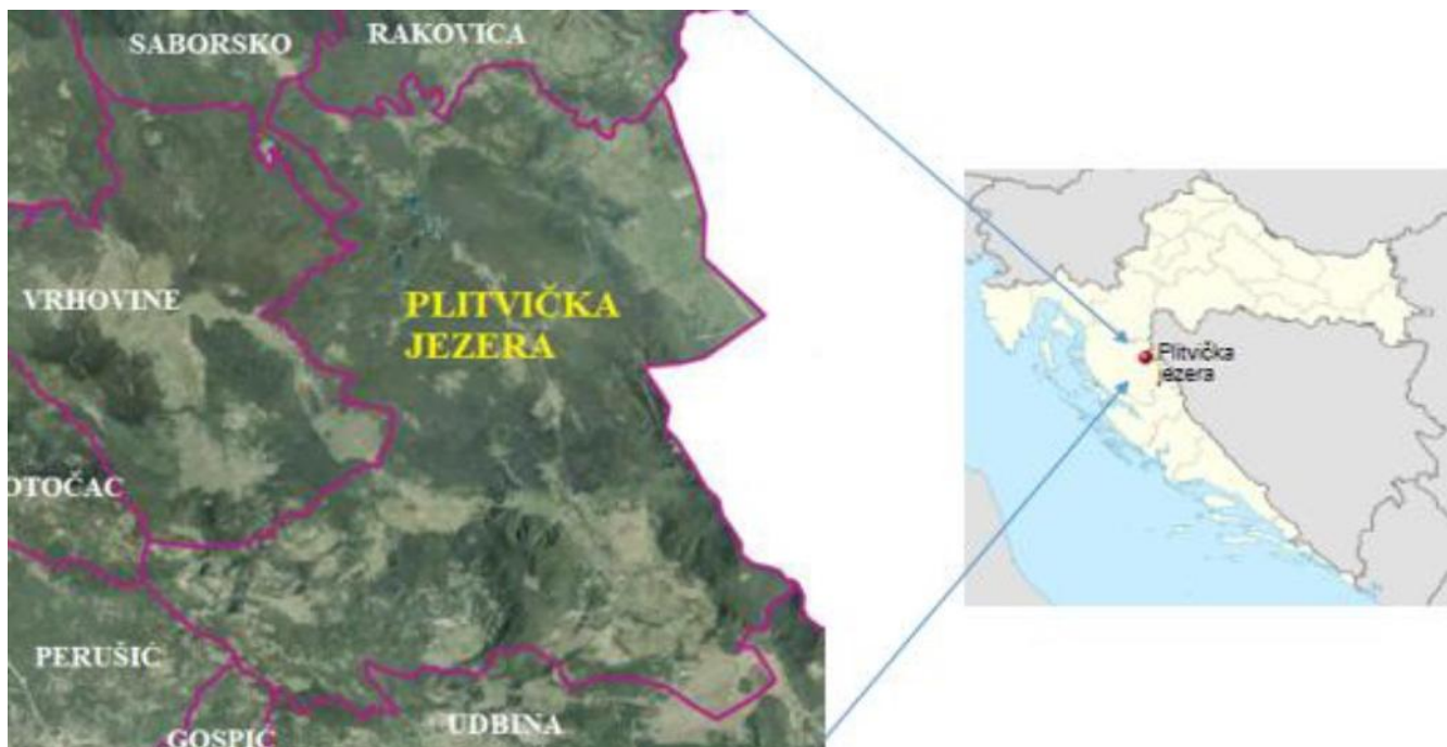
Slika 5. Geografski položaj Općine Plitvička Jezera

Općina Plitvička Jezera smještena je na sjeveroistoku Ličko-senjske županije. Na zapadu graniči općinama Vrhovine, Perušić i Gradom Otočcom, na jugu Općinom Udbine i Gradom Gospićem, na istoku s državom Bosnom i Hercegovinom te na sjeveru s općinama Rakovice i Saborsko.