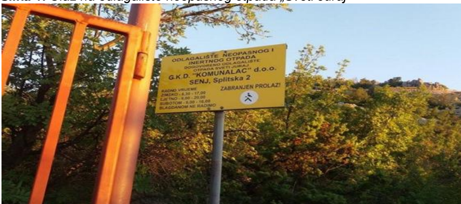
Slika 1: Ulaz na odlagalište neopasnog otpada „Sveti Juraj“

Reciklažno dvorište Senj upisano je u Očevidnik reciklažnih dvorišta (KLASA: 351-02/18-138/21, URBROJ: 517-03-2-2-18-2) Ministarstva zaštite okoliša i energetike, Uprave za procjenu utjecaja na okoliš i održivo gospodarenje otpadom dana 31. listopada 2018. godine pod brojem upisa: GRADSKO KOMUNALNO DRUŠTVO SENJ d.o.o. - REC - 114.