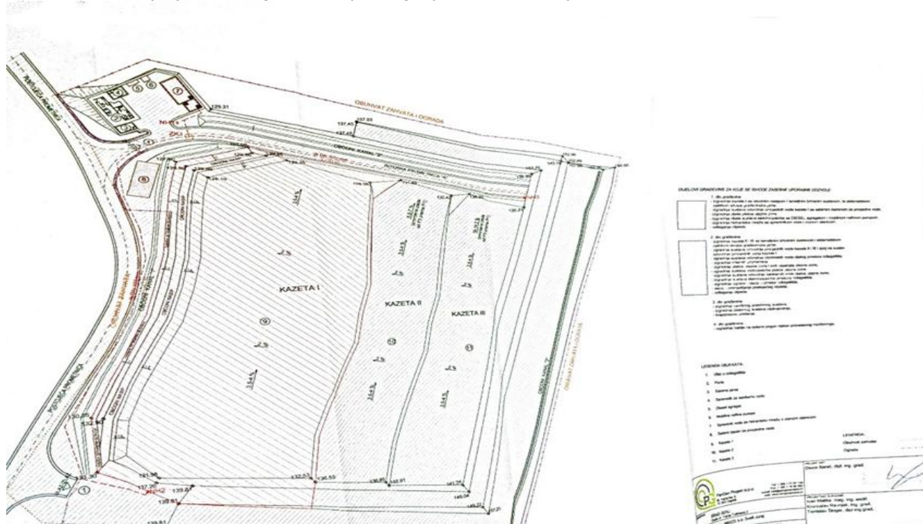
Slika 4: Izvadak iz projekta Odlagalište neopasnog otpada "Sveti Juraj"

Postupak sanacije i zatvaranja ovog odlagališta otpočeo je 2005. godine i to izradom Idejnog rješenja sanacije postojećeg odlagališta s nastavkom rada do konačnog zatvaranja, te izradom Studije o utjecaju na okoliš ciljanog sadržaja sanacije i konačnog zatvaranja odlagališta s rokom korištenja do kraja 2018. godine.