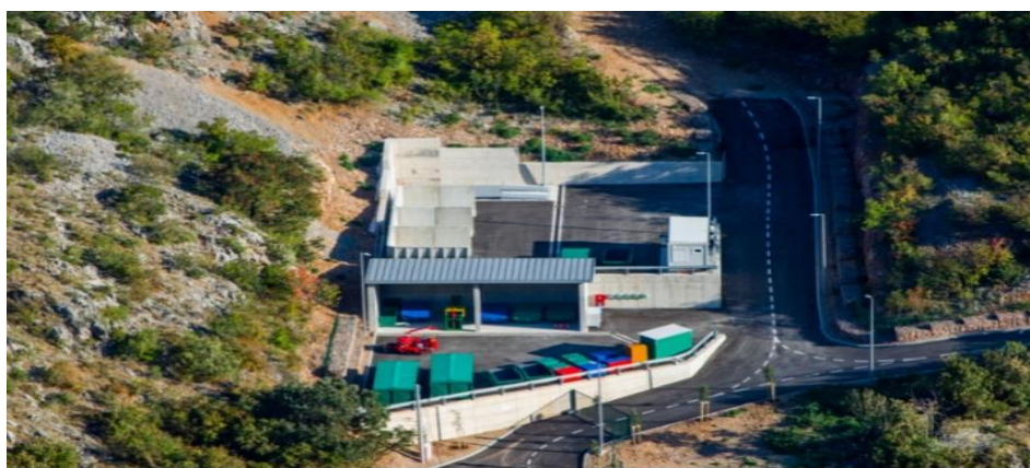
Slika 3: Reciklažno dvorište