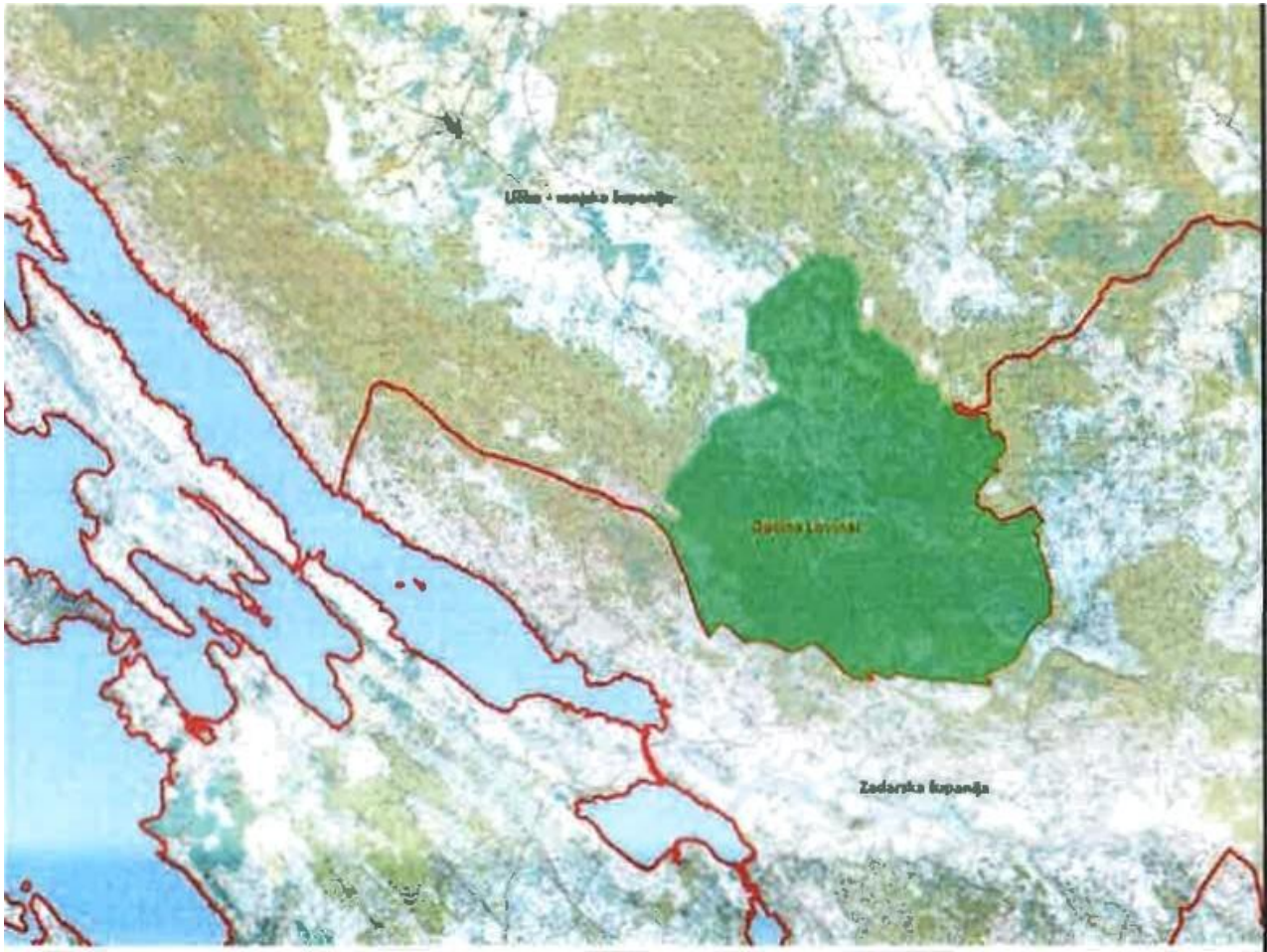
Slika 1. Položaj Općine Lovinac unutar Ličko-senjske županije

i važnost geografskog položaja općine proizlaze iz njezina smještaja na rubu Ličke zavale koja je prirodno povezana s Gračačkim poljem.