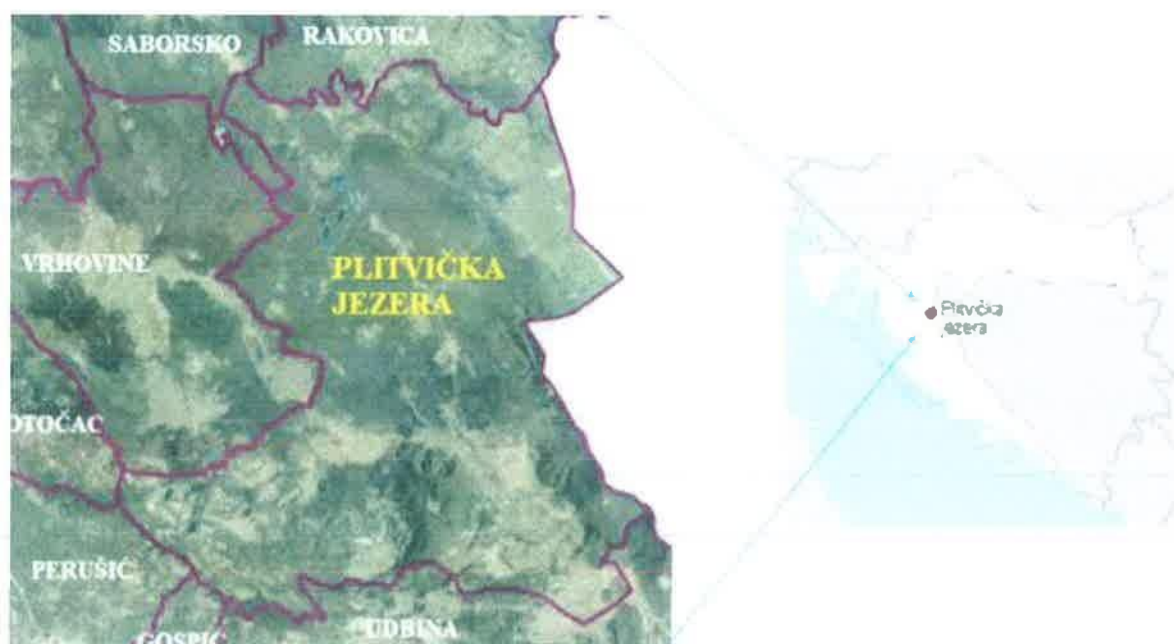
Slika 1. Geografski položaj Općine Plitvička Jezera

Općina Plitvička Jezera smještena je na sjeveroistoku Ličko-senjske županije. Na zapadu graniči općinama Vrhovine, Perušić i Gradom Otočcom, na jugu Općinom Udbine i Gradom Gospićem, na istoku s državom Bosnom i Hercegovinom te na sjeveru s općinama Rakovice i Saborsko.