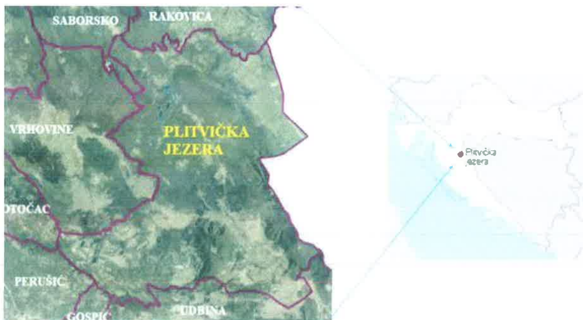
Slika 1. Geografski položaj Općine Plitvička Jezera

Općina Plitvička Jezera smještena je na sjeveroistoku Ličko-senjske županije. Na zapadu graniči općinama Vrhovine, Perušić i Gradom Otočcom, na jugu Općinom Udbine i Gradom Gospićem, na istoku s državom Bosnom i Hercegovinom te na sjeveru s općinama Rakovice i Saborsko.