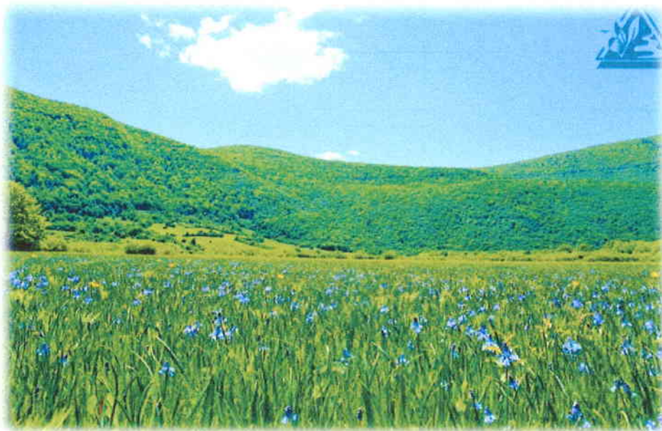
Slika 11. Livadni procjepak ( Chouardia litardierei ) u Lapačkom polju

Praćenje stanja livadnog procjepka ( Chouardia litardierei ) provedeno je u skladu s definiranom metodologijom na 7 lokaliteta unutar Natura 2000 područja HR2001012 Ličko polje (predjeli Trnovac, Bogdanica i Zablate), HR2000632 Krbavsko polje (područje Jošan i Mutilić) i HR2000879 Lapačko polje (područje Lapačke bare).