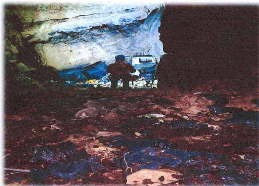
Slika 13. Otpadom kontaminirana „Jama Rastovača“

S obzirom na velik broj speleoloških objekata koji su u nadležnosti Javne ustanove potrebno je donijeti Pravilnik o upravljanju speleološkim objektima