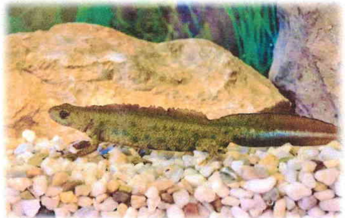
Slika 10. Monitoring velikog vodenjaka ( Triturus carnifex ) u Krbavskom polju