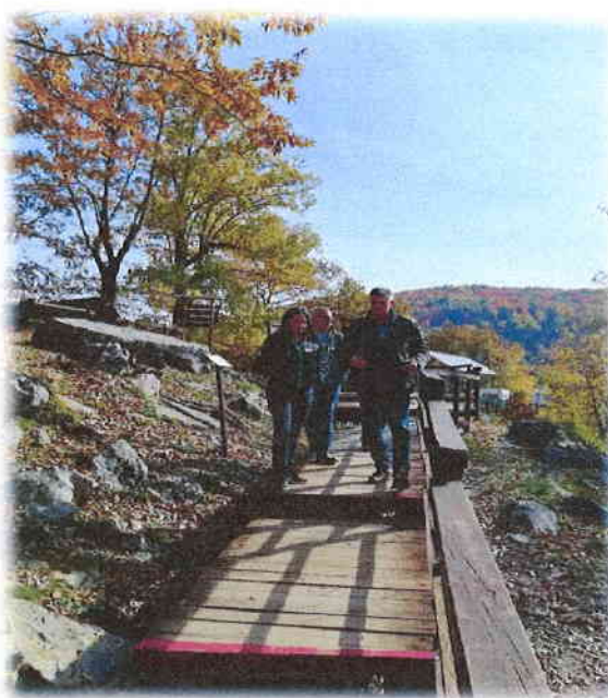
Slika 6. Radni obilazak NP Una s ravnateljem g. Amarildom Mulićem