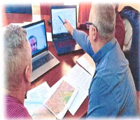
Slika 1. Prva radionica za izradu Plana upravljanja posebnim rezervatom „Laudonov gaj“

Neke od tema raspravljenih na navedenoj radionici bile su vizija zaštite posebnog rezervata, definiranje zona zaštite te razrada ciljeva i aktivnosti Plana upravljanja u skladu s mjerama zaštite.