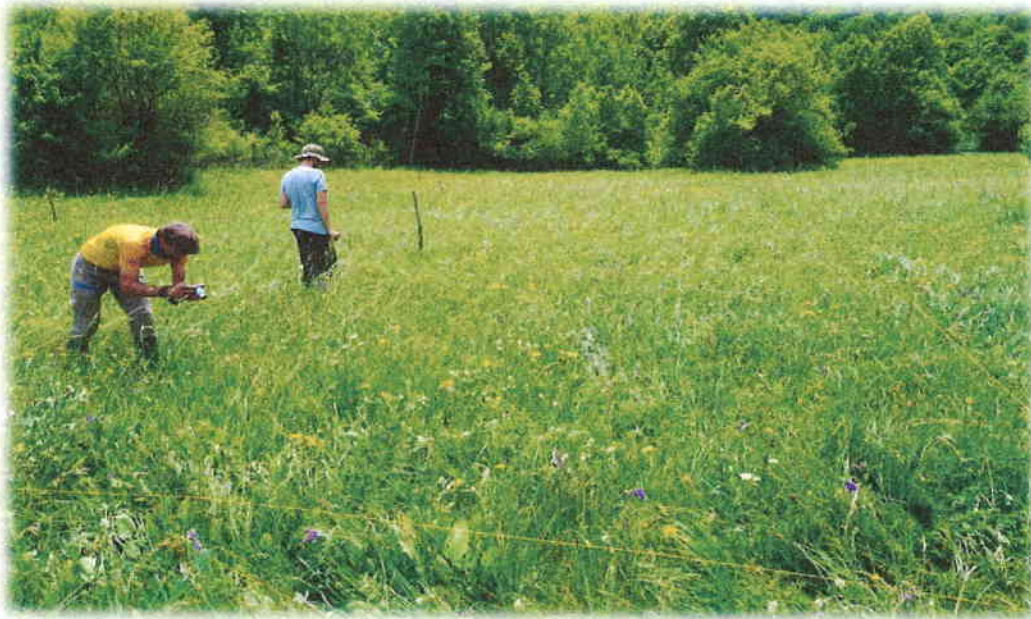
Slika 12. Monitoring nerezgranjenog srpca ( Serratula lycopifolia ) u Dolcu Sekulića

Cjeloviti izvještaj o provedenim monitorinzima vrsta livadni procjepak ( Chouardia litardierei ) i nerazgranjeni srpac ( Serratula lycopifolia ) dostupan je na mrežnom mjestu Javne ustanove https://zop-lsz.hr/izvjestaji-i-elaborati/ .