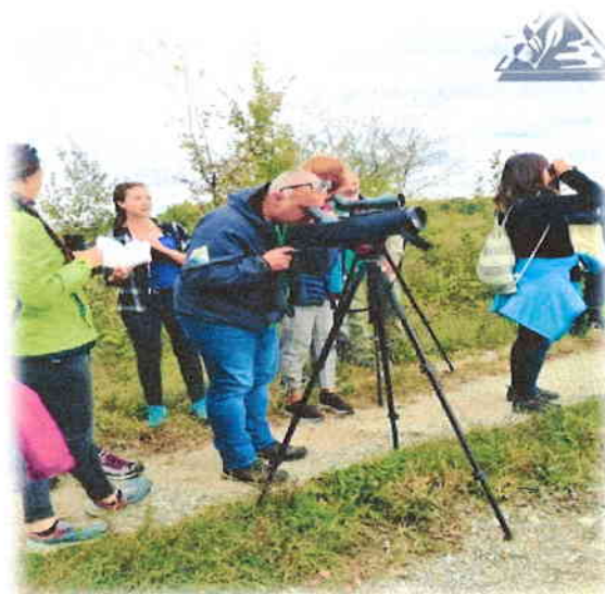
Slika 7. Skup stručnih službi u Jastrebarskom i radni posjet rezervatu Crna Mlaka