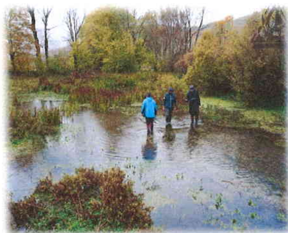
Slika 9. Monitoring potočnog raka ( Austropotamobius torrentium ) u potoku Krasulja u Krbavici

Podaci prikupljeni ovim istraživanjem koristit će se za izradu plana upravljanja ovom strogo zaštićenom vrstom.