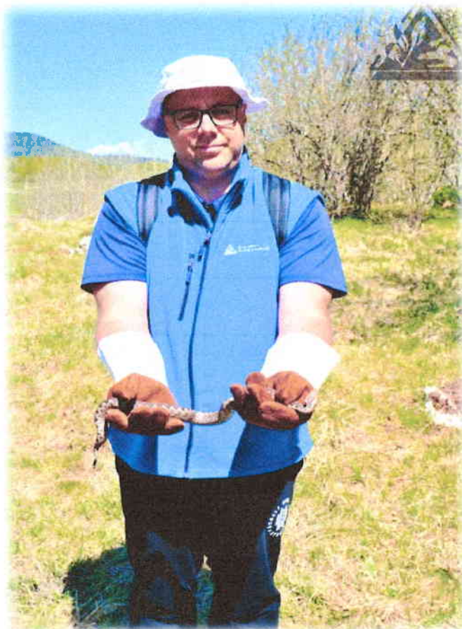
Slika 2. Monitoring poskoka u Malom Kamenskom na Ličkoj Plješivici