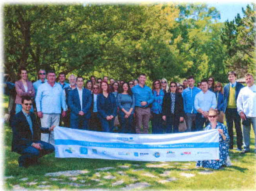
Slika 4. Sudionici skupa Hrvatska mreža morskih zaštićenih područja-HRMZP

Potpisnice sporazuma su sve hrvatske javne ustanove koje upravljaju dijelovima morskog ekosustava, odnosno 15 ustanova, među kojima je i Javna ustanova za zaštitu i očuvanje prirode Ličko-senjske županije.