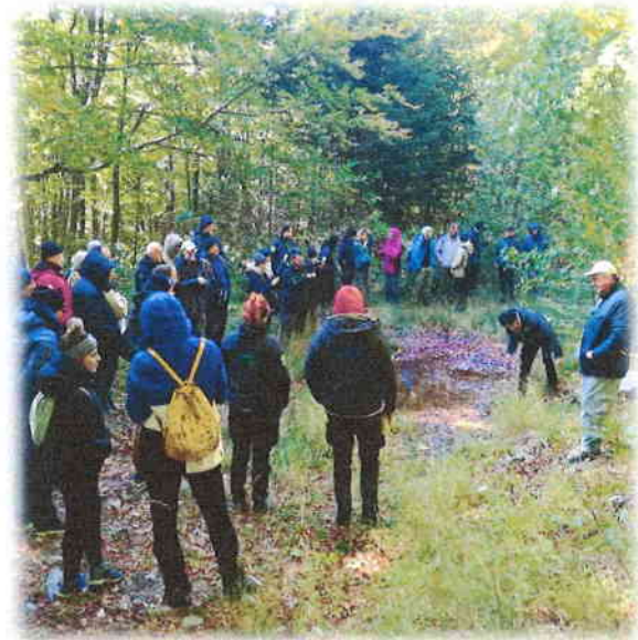
Slika 8. Terenski obilazak Parka prirode Velebit